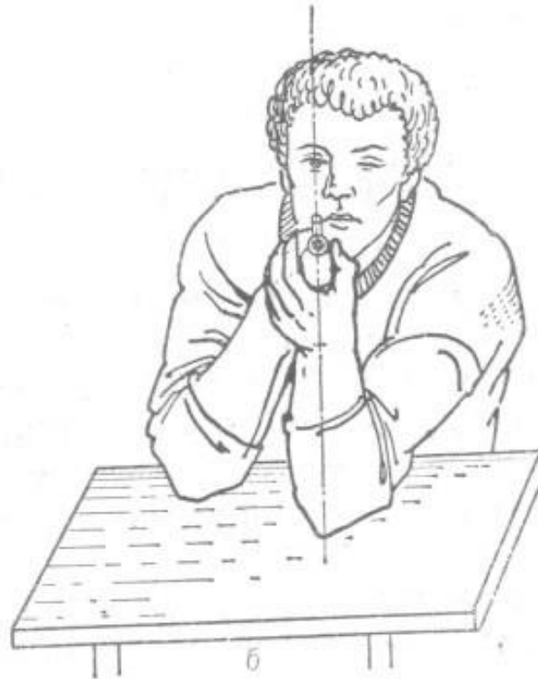
Рис. 1 Изготовка для стрельбы сидя за столом с опорой локтями о стол. Винтовка над левым локтем: а – вид сбоку; б – вид спереди

Если оказалось, что мушка винтовки не совпадает с точкой прицеливания, то надо уточнить наводку винтовки, но не нарушая систему «стрелок – оружие», т. е. не сдвигая винтовки относительно тела стрелка.